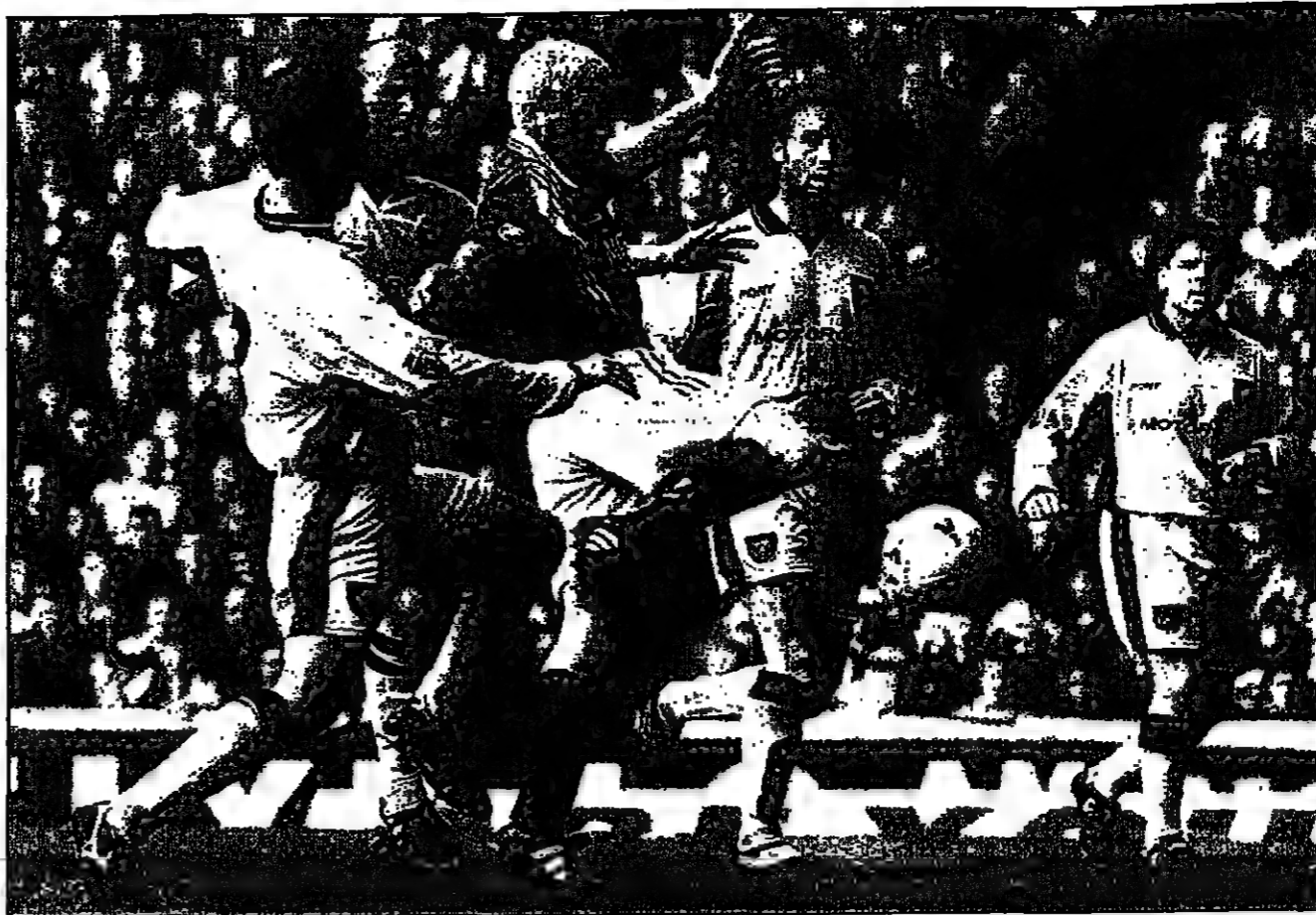
لاعبون من نادي انتر ميلان الايطالي في مباراة الذهاب في نهائي كأس الاتحاد الأوروبي.